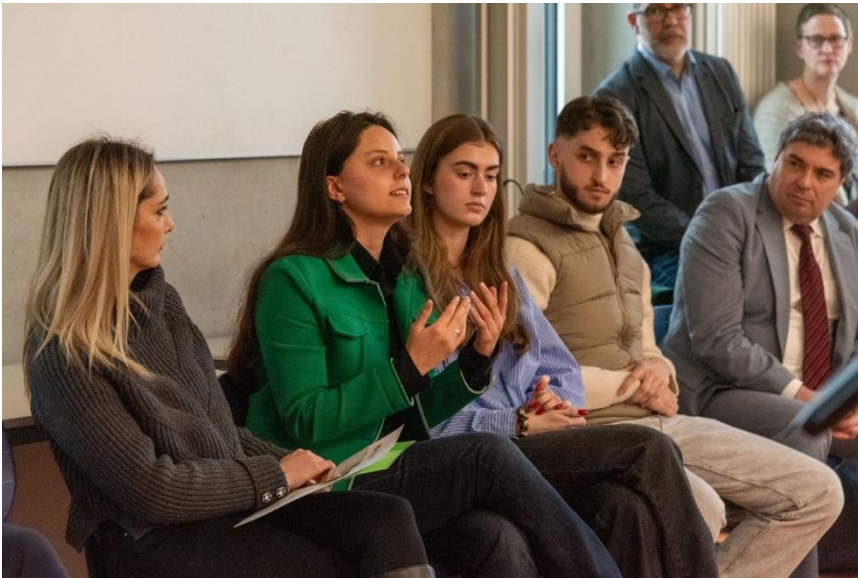
Diskussion mit SV u. Eltern bei Ministerbesuch Schwarz, 3.2024

• Alle Infos siehe auch www.cvossietzky.de