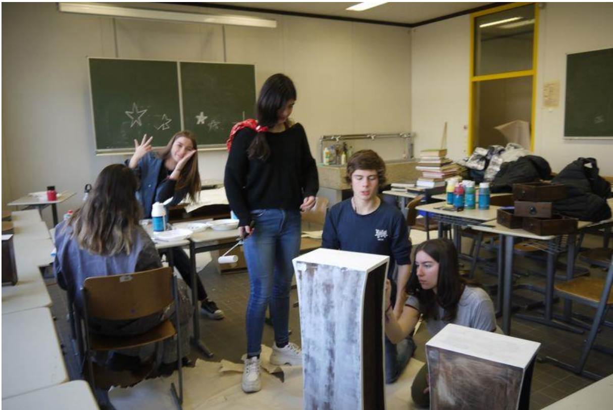
Tatkräftig am Gestalten während der Projektwoche...