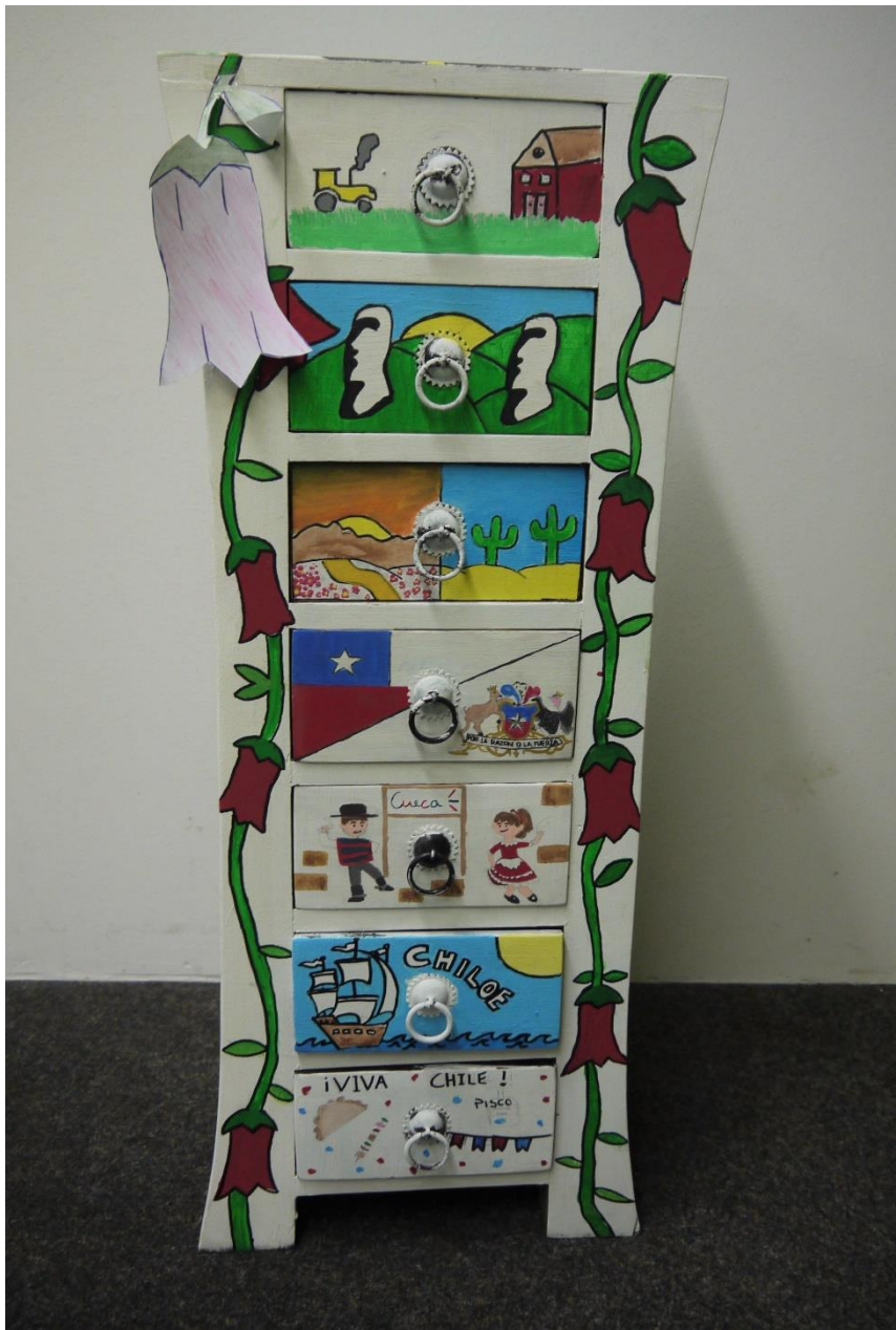
...mit gelundgenem Ergebnis: der Chile-Schrank, der nun in der Schüleroase steht.