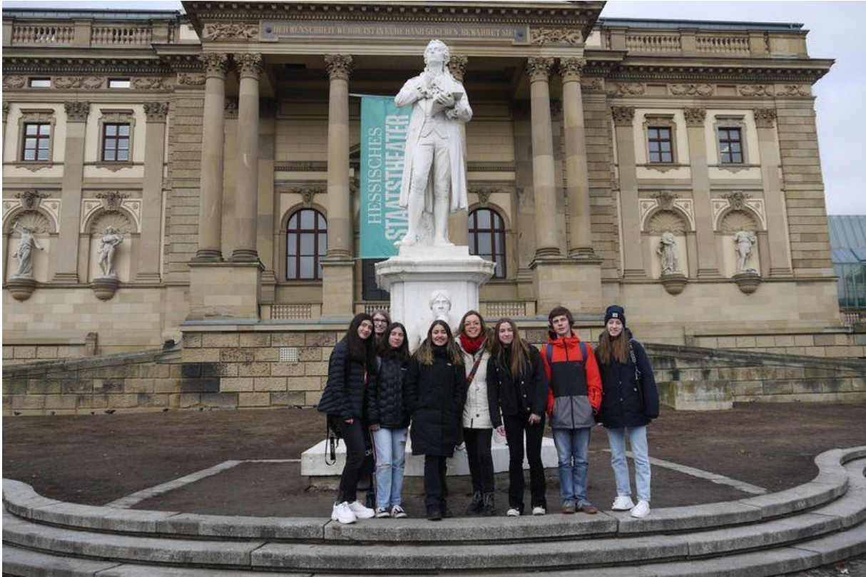
Unternehmungen rund um Wiesbaden mit der gesamten Gruppe